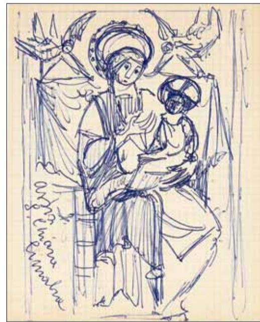
Remo Rossi, "Madonna della Cortina", studio, 1961.

mostra In viaggio . Remo Rossi. Appunti di uno scultore . Una quarantina di disegni tra penne e matite, piccola parte dei fogli che costituiscono i suoi cahiers de voyage , comunque rappresentativi di un metodo e di un genere. Ossia dell'abitudine di prendere appunti attraverso il disegno lungo i soggiorni di studio, non tanto per trarne ispirazione per future opere, quanto proprio per documentarsi dal vivo, studiare, copiare personalizzando. A volte con un segno ribadito, a volte con semplici schizzi. Siccome non aveva l'abitudine di datare questi fogli, ma solo di metterci brevi appunti e talvolta l'indicazione del luogo, ecco l'occasione di approfondire ogni disegno, di saperne di più, di inserirli all'interno dell'avventura biografica e dell'opera dell'artista. Nel catalogo della mostra Diana Rizzi, presidente della Fondazione, accompagna l'artista e le sue memorie in questo ritorno a casa; Ilaria Filardi, collaboratrice scientifica, si sofferma su ognuno dei disegni recuperando tutti i possibili riferimenti, stabilendo le cronologie, inserendoli nell'opera complessiva di colui che era stato definito "l'ultimo dei giganti". Grande artista, grande personalità, grande potere, troppo per alcuni.