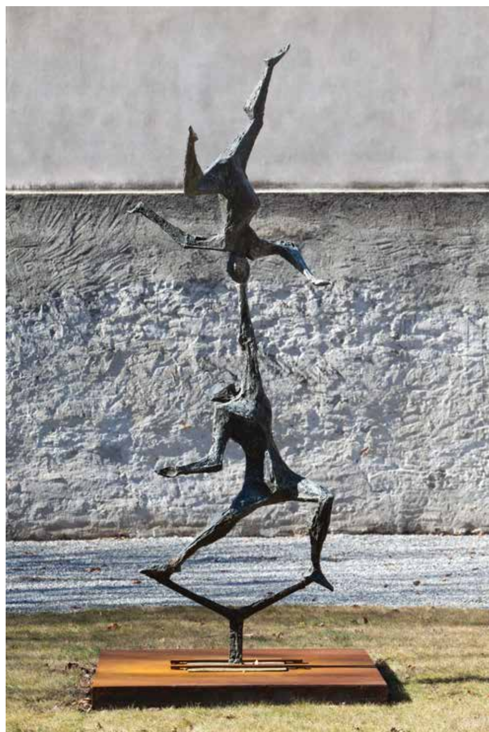
Remo Rossi, Acrobati, 1961, Locarno, Antico convento di S. Francesco, Piazza S. Francesco

tendosi anche nelle opere grafiche, come nelle numerose litografie. Nella realizzazione dei suoi Acrobati, Remo Rossi non si sofferma sulla resa reale dell'anatomia umana, ma percorre la via della stilizzazione e dell'irrigidimento delle forme. Il risultato si concretizza così nella scomposizione geometrica dei corpi, nelle linee spezzate, a sottolineare l'equilibrio precario in lotta con la forza dinamica: la serie di litografie che raffigurano gli "Acrobati" del 1961, esposta in questa sede, lo dimostra bene. Il medesimo soggetto è stato realizzato anche in versioni scultoree di diverse dimensioni. Nel 2009 è stata collocata l'opera in bronzo all'ingresso dell'antico convento di S. Francesco a Locarno, mentre nel 2011 è stato posto nel giardino del Parco comunale di Orselina il gruppo scultoreo che fu esposto nel 1964 all'Esposizione nazionale di Losanna (fu dorato per l'occasione), grazie alla donazione di un privato cittadino.