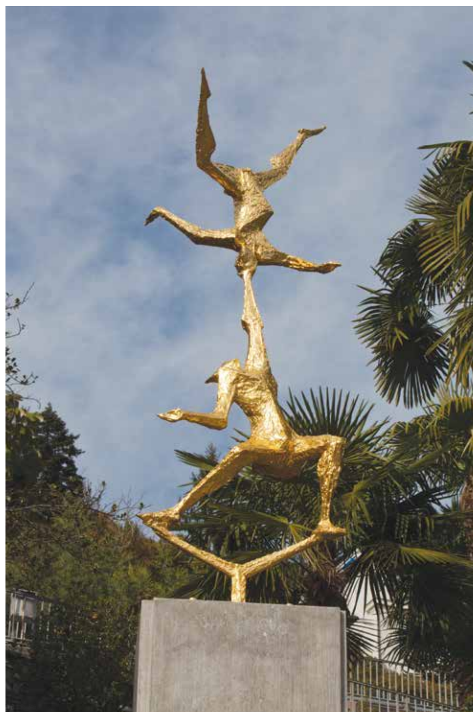
Remo Rossi, Acrobati, 1961, Orselina, Parco comunale